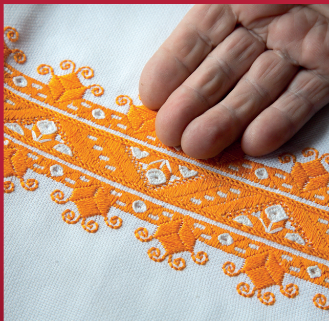
Vytvářeno za podpory Ministerstva kultury ČR v rámci programu Tradiční lidová kultura, 2016.

Řečeno jinými slovy: nejde o pouťový jarmark, ale o zachycení zachovaných řemesel v jejich původní technologické čistotě. Organizátorům jde také o předvedení co největšího počtu druhů řemesel. Přehlídka si získala v kraji svou oblibenost, o čemž svědčí narůstající počet návštěvníků. Ten každoročně přesáhne hranici čtyř tisíc. Jen v roce 2015 byla účast menší z důvodu extrémně horkého počasí. Přehlídku řemeslných dovedností doplňuje řemeslný trh, bohatý celodenní kulturní program, možnost občerstvení v duchu staročeské kuchyně, významná je i nabídka výstav a expozic v areálu zámku a Expozice lidové architektury v Chanovicích. Akce nabízí kvalitní celodenní program pro jednotlivce i rodiny. Vedle návštěvníků z řad místních obyvatel a okolí navštíví v tento den Chanovice i zájemci z okresu Klatovy, Plzeň-jih a Strakonice. Výrazné zastoupení zde také mají chatáři a chalupáři z Pošumaví a Brd. Den řemesel se stal i příležitostí pro rodinná a společenská setkání, navazování nových přátelství, kontaktů, nebo i osobní jednání. To by mohlo být novým impulzem pro alespoň částečné oživení tradičního společenského a kulturního venkovského života. Přehlídka řemeslných dovedností Plzeňského kraje je podpořena z rozpočtu Plzeňského kraje a účelovou dotací Ministerstva kultury ČR a stala se výraznou podporou účinnější péče o tradiční lidovou kulturu v České republice.